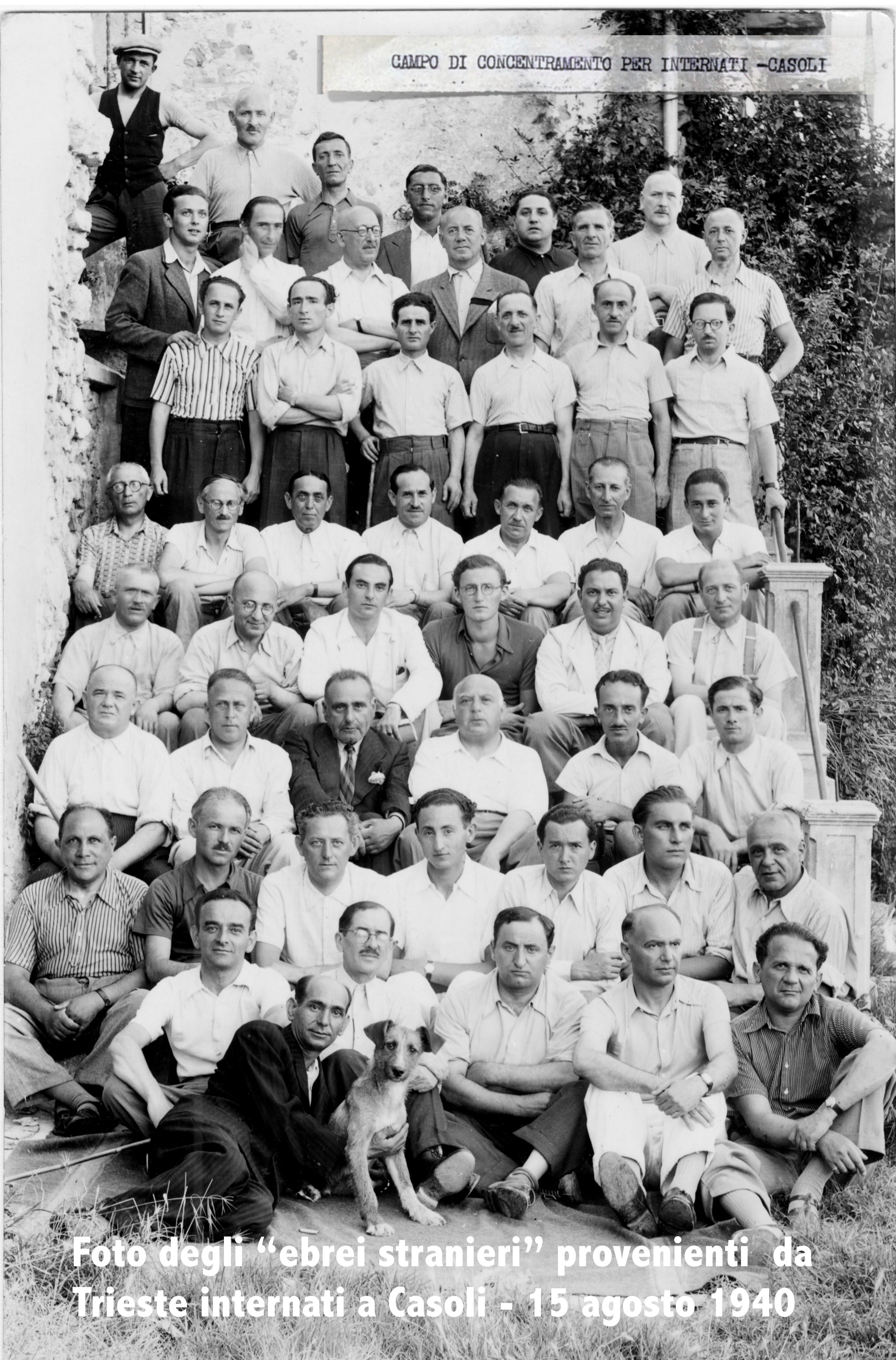
Foto degli "ebrei stranieri" provenienti da Trieste internati a Casoli - 15 agosto 1940