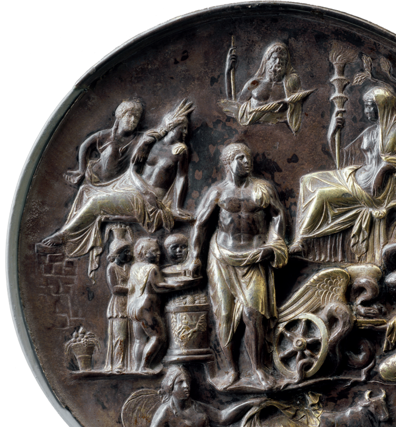
Right: Silver plate with allegorical representation of fertility, second half of 1st century BC