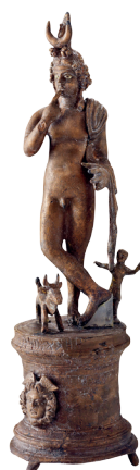
Statuetta di Arpocrate con nome del proprietario o dell'artista I-III secolo d.C. Bronzo h 32 cm, spess. max. 9,2 cm Qaryat al-Faw Museo del Dipartimento di Archeologia, King Saud University, Riad