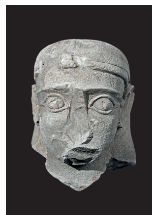
Testa di una statua monumentale della dinastia lihyanita V-II secolo a.C. Pietra 47 x 49 x 51 cm Tayma, missione archeologica tedesca-saudita, Yard E, deposito dell'antico Tempio E-b1 Missione archeologica tedesca- saudita, Tayma Museum,