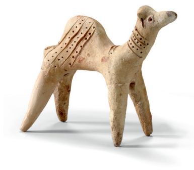
Statuetta di dromedario III secolo a.C. - III secolo d.C. Argilla h 15,3 cm Qaryat al-Faw Museo del Dipartimento di Archeologia, King Saud University, Riad