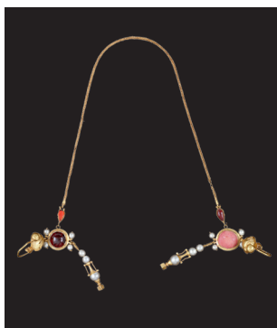
Gioiello frontale II secolo d.C. Oro, pietre semipreziose e perle l. 41,5 cm Tomba di Ayn Jawan Museo Nazionale, Riad