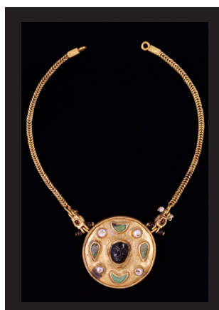
Collana I secolo d.C. Oro, perle, turchese e rubino diam. 38,5 cm (collana), 5 cm (pendaglio) Thaj, Tell al-Zayer Museo Nazionale, Riad