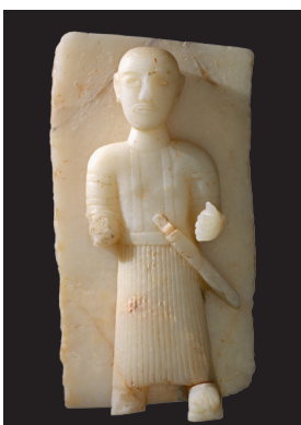
Stele raffigurante un uomo con pugnale I-III secolo d.C. Alabastro calcareo 57×30 cm Qaryat al-Faw Museo del Dipartimento di Archeologia King Saud University, Riad