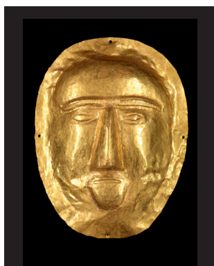
Maschera funeraria I secolo d.C. Oro, 17,5 x 13 cm Thaj, Tell al-Zayer Museo Nazionale, Riad

Immagini disponibili al link: https://www.electa.it/ufficio-stampa/?categoria-presskit=electa-mostre