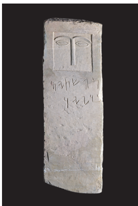
Stele con occhi: volto umano e iscrizione aramaica V-IV secolo a.C. Arenaria 26×15×72 cm Tayma, ritrovamento sporadico Museo di Tayma