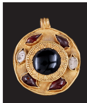
Pendente rotondo con granati e perle incastonate II secolo d.C. Oro, cabochon di granato a goccia e perle diam. 2,2 cm Tomba di Ayn Jawan Museo Nazionale, Riad