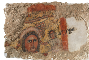
Frammento di pittura parietale con testa virile e iscrizione in sudarabico antico: scena di banchetto (?) I-II secolo d.C. Pittura nera, rossa e gialla su intonaco bianco 53×36 cm Qaryat al-Faw, quartiere residenziale (palazzo) National Museum, Riad