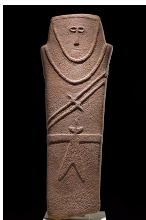
Statua stele con disegni in rilievo IV millennio a.C. Arenaria 57 x 27 x 5 cm Al-Ula Museo Nazionale, Riad