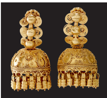
Orecchini a campanella I-III secolo d.C. circa Oro h 3,4 cm, diam. 2 cm circa Qaryat al-Faw Museo del Dipartimento di Archeologia, King Saud University, Riad