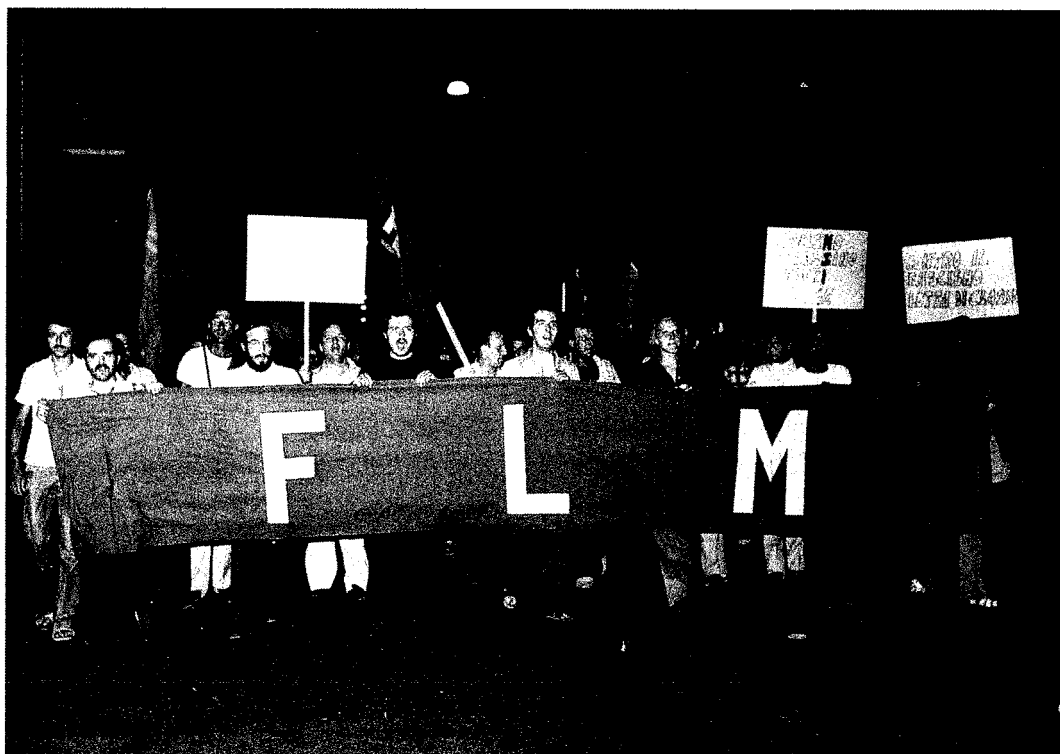
Manifestazione antifascista intorno al 1975.