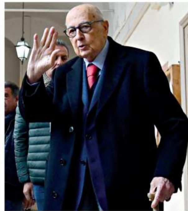
◀ Presidente emerito Giorgio Napolitano, 95 anni