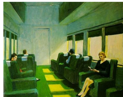
E. Hopper, Chair car , olio su tela, 1965

129 Noi leggiavamo un giorno per diletto di Lancialotto come amor lo strinse; soli eravamo e senza alcun sospetto.