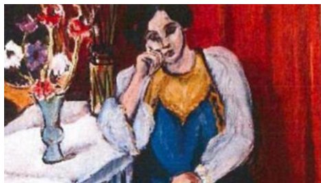
H. Matisse, La lettrice in abito bianco e giallo , 1919